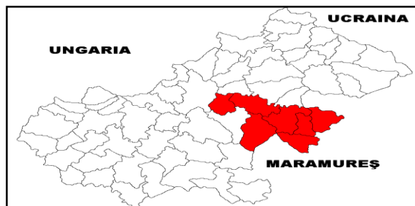
Figura 9.3.1. Asocieria Microregională Someș-Sud