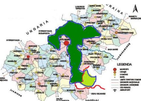
Figura 9.4.2. GAL zona Sătmar

i Orientare Modernă, Strategia până în 2020, Cod SMIS 2951